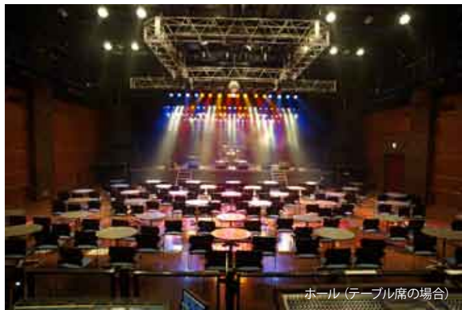
ホール(テーブル席の場合)