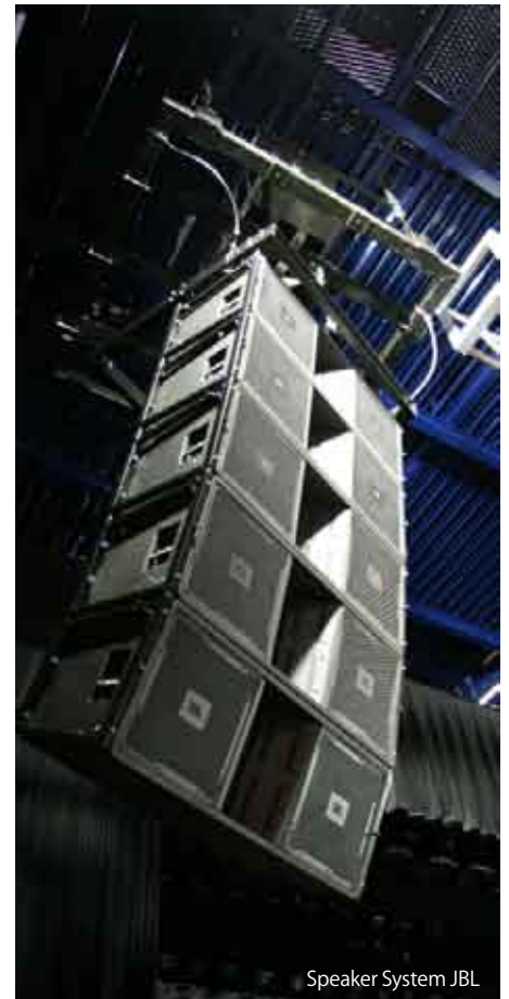
Speaker System JBL