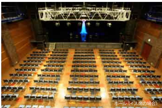
ホール(イス席の場合)