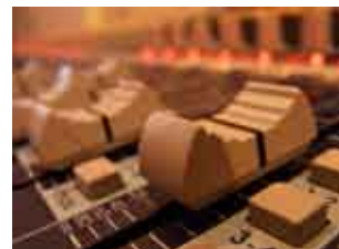
“最大で1,100人収容可能な集客スペースを配するライブハウス” 『ミュージックタウン音市場』